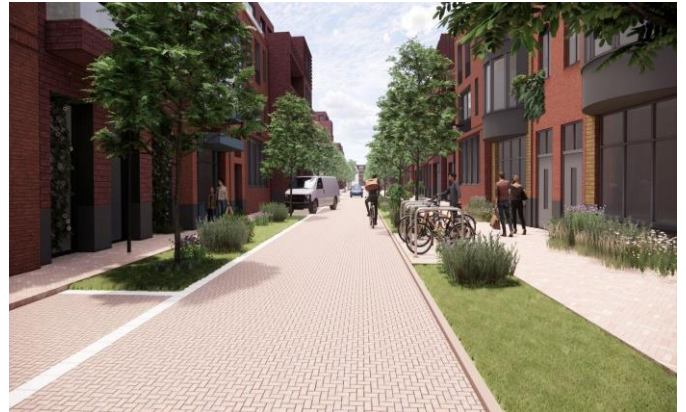
Figuur 2 - voorbeeld van toekomstig beeld