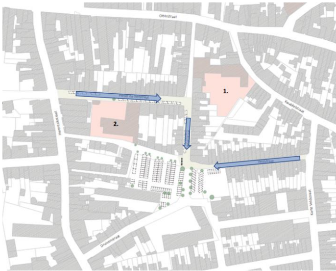
Figuur 3 - circulatie verkeer