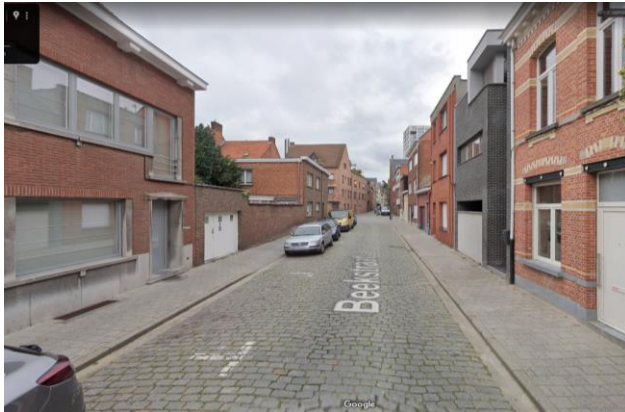
Figuur 1 - huidig wegbeeld

Aangenaam voor bewoners, veilig voor weggebruikers.