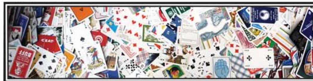
Turnhoutse Route voor Archief en Musea