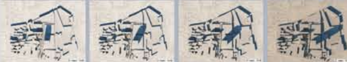
De schaduwstudie bij het begin van de lente

De milieueffectrapportage (MER) onderzocht de plannen op gevolgen voor omgeving en mens. Schaduw en wind, verkeer en geluid, water en erfgoed zijn door deskundigen bekeken.